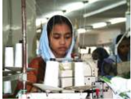
garment worker bangladesh

Pour plus d'éléments sur les avancées en Europe : http://forumcitoyenpouarlarse.org/infographie-sur-le-devoir-de-vigilance-en-europe-nouvelle-publication-du-fcrse/