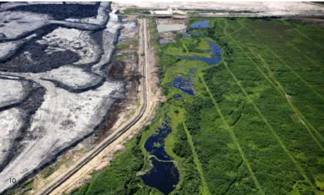
Sables bitumineux (Canada)