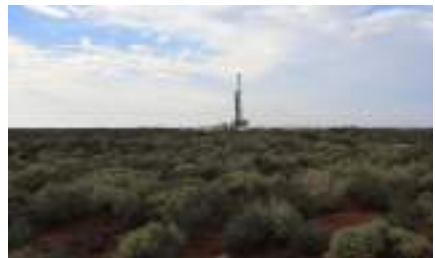
Puits de gaz de saline (Argentine)

Le fait d'instaurer légalement une obligation de vigilance pour les entreprises en matière de droits humains devrait contribuer à donner progressivement la priorité aux risques pour les personnes et l'environnement plutôt qu'aux profits pour les entreprises.