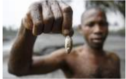
Fisherman showing effect of oil pollution in local creek. Goa

Contrairement à d'autres initiatives législatives, sectorielles ou limitées au niveau européen ou dans d'autres pays (secteur extractif, lois anti-corruption, travail des enfants etc.), la loi française sur le devoir de vigilance des multinationales est aussi unique en son genre car elle couvre tous les secteurs d'activité, et un large domaine d'application . Ainsi, sont concernées les « atteintes graves envers les droits humains et les libertés fondamentales, la santé et la sécurité des personnes ainsi que l'environnement ».