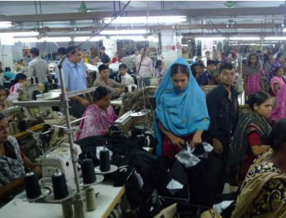
Bangladesh - Atelier