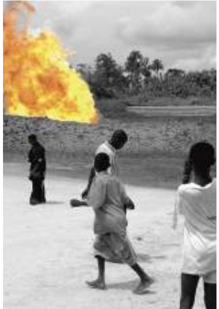
Incendie de gaz (Nigeria)