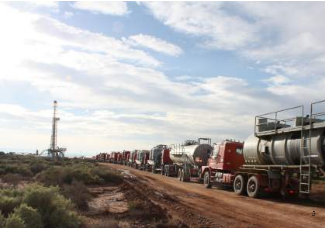
Puits de gaz de schiste (Argentine)