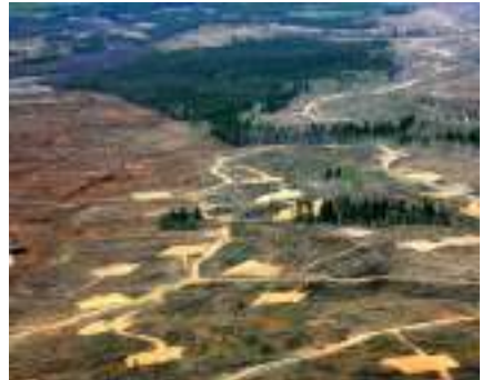
Sables d'Alumineux (Canada)

Cette notion couvre ainsi tous les types de relations entre professionnels, définies comme des relations régulières et stables, avec ou sans contrat, avec un certain volume d'affaires et dont on s'attend raisonnablement à ce qu'elle soit durable. L'article L. 442-6, I, 5° du Code de commerce s'applique également à l'achat et à la vente de produits et à la prestation de services. Les sous-traitants et fournisseurs peuvent être ceux de la société-mère comme ceux des filiales ou sociétés contrôlées.