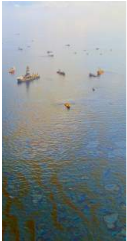
Explosion de la plateforme pétrolière Deepwater Horizon.

La troisième session de négociations à Genève, du 23 au 27 Octobre 2017 ouvre une étape décisive, puisque sera discutée une première proposition écrite de Traité, présentée par l'Équateur. En vue de cette prochaine session, l'Alliance pour un Traité a élaboré une nouvelle déclaration, avec l'objectif de récolter 2000 signatures d'organisations, mouvements sociaux et personnalités à travers le monde, afin de faire pression sur les États réticents tels que l'Union européenne et ses États membres, dont la France 20 .