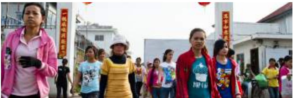
Enfants et Comment - © Morini De Wels