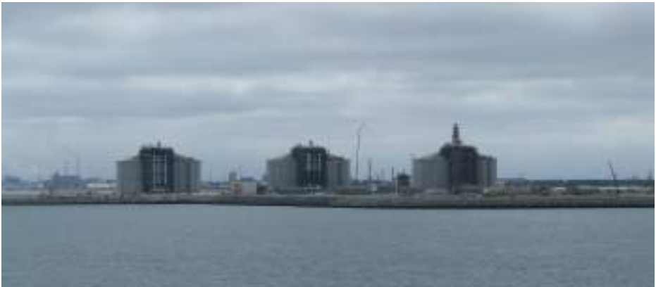
Thierry Maffre / Agence France Presse - © Nicolas Fourmier

La nouvelle loi française relative au devoir de vigilance des sociétés mères et entreprises donneuses d'ordre 2 , entrée en vigueur en mars 2017 après un long parcours parlementaire, montre que la prévention des risques de violations des droits humains et des dommages environnementaux peut constituer une obligation légale pour les multinationales. Cette loi permet enfin d'appréhender la complexité juridique des groupes de sociétés ainsi que la multiplicité des relations commerciales qu'elles peuvent entretenir avec d'autres acteurs économiques.