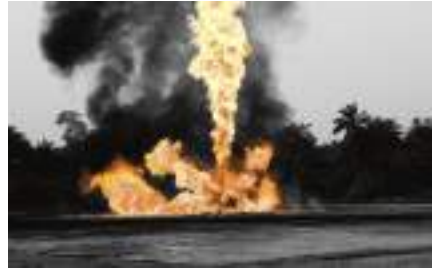
Incendie de gaz (Nigeria)

Selon les informations les plus récentes disponibles au moment de la publication de la loi, environ 150 grandes multinationales établies en France seraient ainsi concernées.