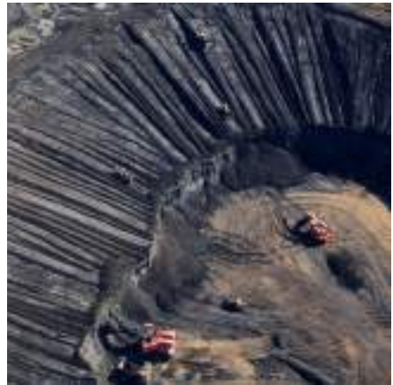
Sables bitumineux (Canada)

Les premières actions en justice seront possibles à compter de la publication du rapport portant sur le premier exercice ouvert après la publication de la loi, c'est-à-dire en 2019 .